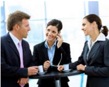
Gelassenheit im Berufsalltag Abbau von chronischem Stress hat eine positive Wirkung auf Körper und Geist.

Autogenes Training kann nachweislich folgende Symptomen lindern: Konzentrationsstörungen, Kopfschmerzen, Nervosität, vegetative Beschwerden. Es hilft darüber hinaus bei der Bewältigung von Stress sowie Belastungs- und Angstsituationen.